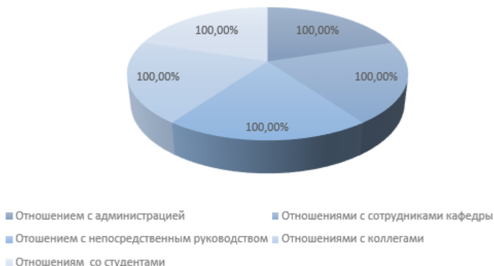
Диаграмма 3. Результаты опроса по вопросу 3.