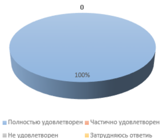
Диаграмма 1. Результаты опроса по вопросу 1.