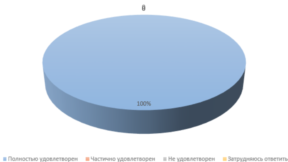
Диаграмма 5. Результаты опроса по вопросу 5

Оценка качества деятельности педагогического работника и его профессионального мастерства является важной составляющей внутренней системы оценки качества образования Филиала института, служит основанием для решения задач управления качеством образования в организации и качеством подготовки обучающихся. Вместе с тем, выстраивание единой и непрерывной вариативной системы адресного научно-методического сопровождения роста педагогического мастерства способствует повышению качества образования на всех уровнях.